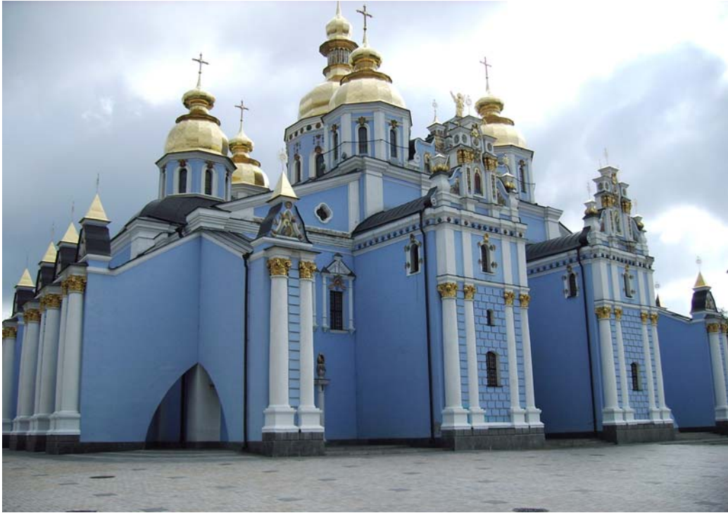
Klosterkirche St. Michael, Kiev