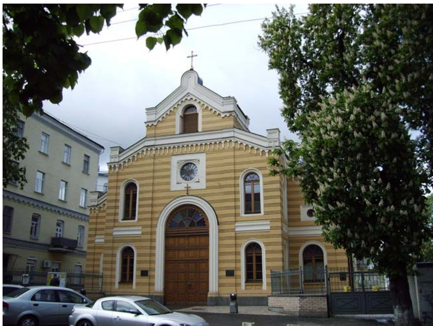
Deutsche evangelisch-lutherische Kirche in Kiew