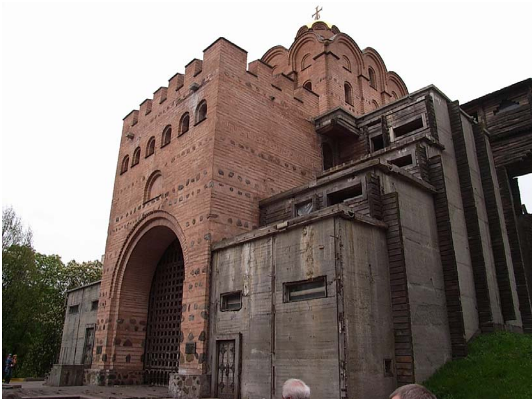
Goldenes Tor, Kiev